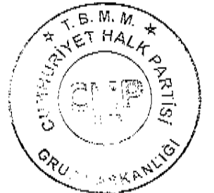
Yüksel Mansur KILIÇ İstanbul Milletvekili